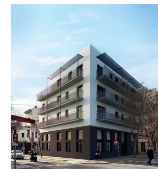
EDIFICI PLURIFAMILIAR EN TESTERA DE 10 HABITATGES I TRASTERS Av. Marquès de Mont-roig, 1-5. 08912. Badalona

Les característiques de l'habitatge i les seves instal·lacions estaran supeditades a les exigències de les normatives vigents, així com a les solucions tècniques determinades per la direcció facultativa. Tot això pot donar lloc a possibles modificacions d'aquest plànol e infografies. El mobiliari, vegetació i elements de decoració representats són merament orientatius i no estan inclosos en els habitatges. Aquest plànol no té validesa legal.