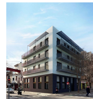
EDIFICI PLURIFAMILIAR EN TESTERA DE 10 HABITATGES I TRASTERS Av. Marquès de Mont-roig, 1-5. 08912. Badalona

Les característiques de l'habitatge i les seves instal·lacions estaran supeditades a les exigències de les normatives vigents, així com a les solucions tècniques determinades per la direcció facultativa. Tot això pot donar lloc a possibles modificacions d'aquest plànol e infografies. El mobiliari, vegetació i elements de decoració representats són merament orientatius i no estan inclosos en els habitatges. Aquest plànol no té validesa legal.